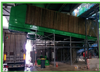
FMA con scarico inferiore