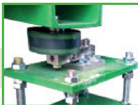
Sistema di pesatura e gestione automatizzata