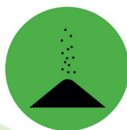
Prodotti di qualità