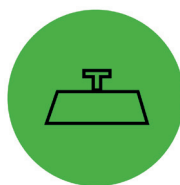
Prodotti ≤ 250 kg/m 3