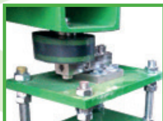
Sistema di pesatura e gestione automatizzata