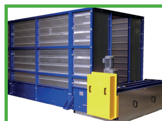
Motorizzazione del tamburo a pedale